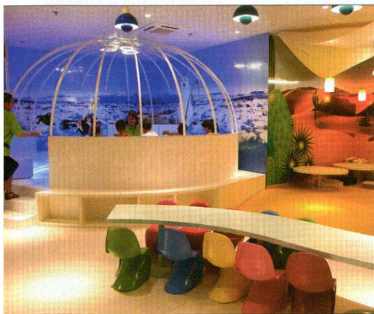
LA GARDERIE. C'est une première en France. L'espace est ouvert les mercredis et samedis pour les enfants de 4 à 12 ans. Moyennant 5 euros, ce service réservé aux clients dotés de la carte de fidélité constitue un vrai produit d'appel. Et les familles sont chouchoutées : des places de parking leur sont réservées à l'entrée du magasin.

l'espace marché, le bio, le surgelé, la beauté, la mode, l'espace bébé, la maison et les loisirs. Des corners occupés par de grandes marques, comme L'Oréal, Apple ou encore Virgin, rappellent l'esprit des grands magasins. Et de nouveaux services font leur apparition, tels ce logiciel de maquillage, une garderie pour enfants et un coiffeur. Carrefour devrait déployer son nouveau concept dès l'automne. Il faudra alors convaincre le consommateur que cette modernisation n'est pas synonyme d'augmentation de prix. Thiébaud Dromard